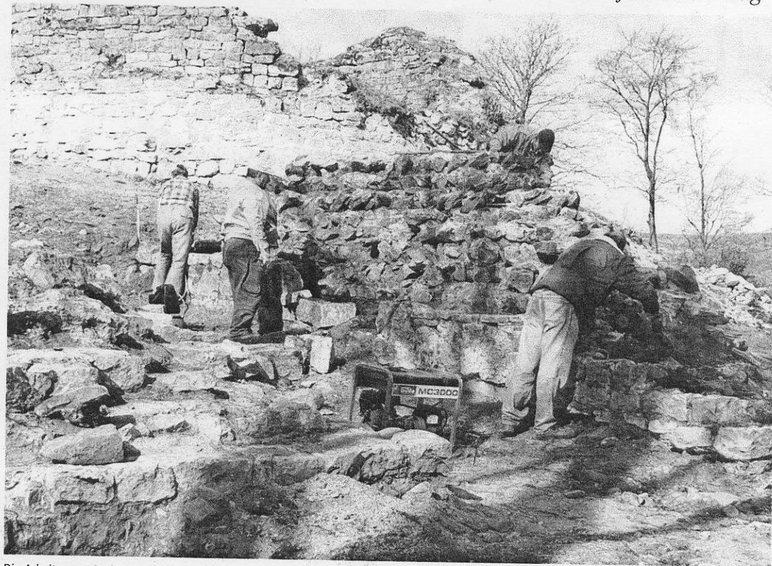
Die Arbeiten zur Sanierung und Sicherung der Burgruine auf der Osterburg haben vor einigen Tagen begonnen. Derzeit sind die Arbeiter an den Torwangen beschäftigt.

Das geschieht natürlich nicht nach dem Belieben des Vereins, sondern nach einem Sanierungskon-